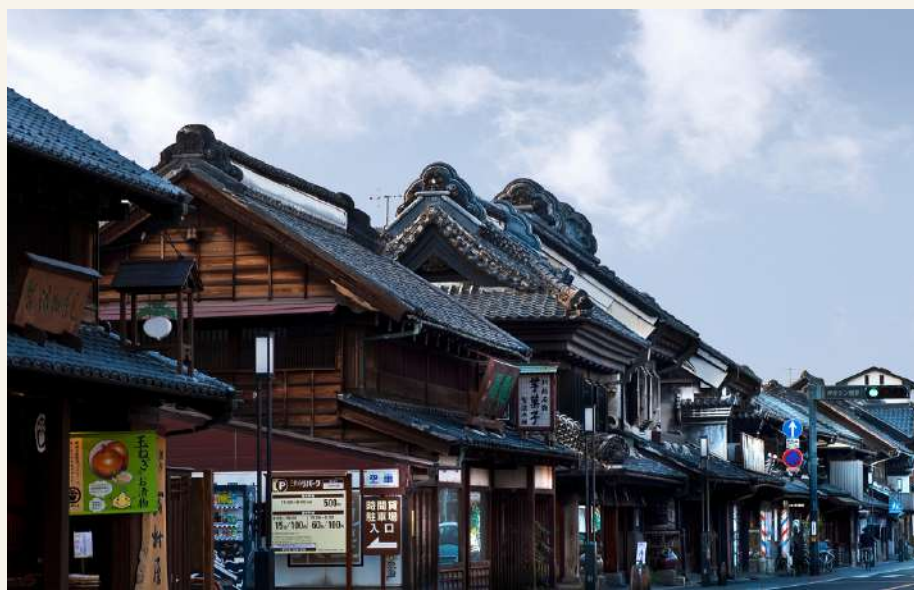
ย่านเมืองเก่าคาวาโกเอะ