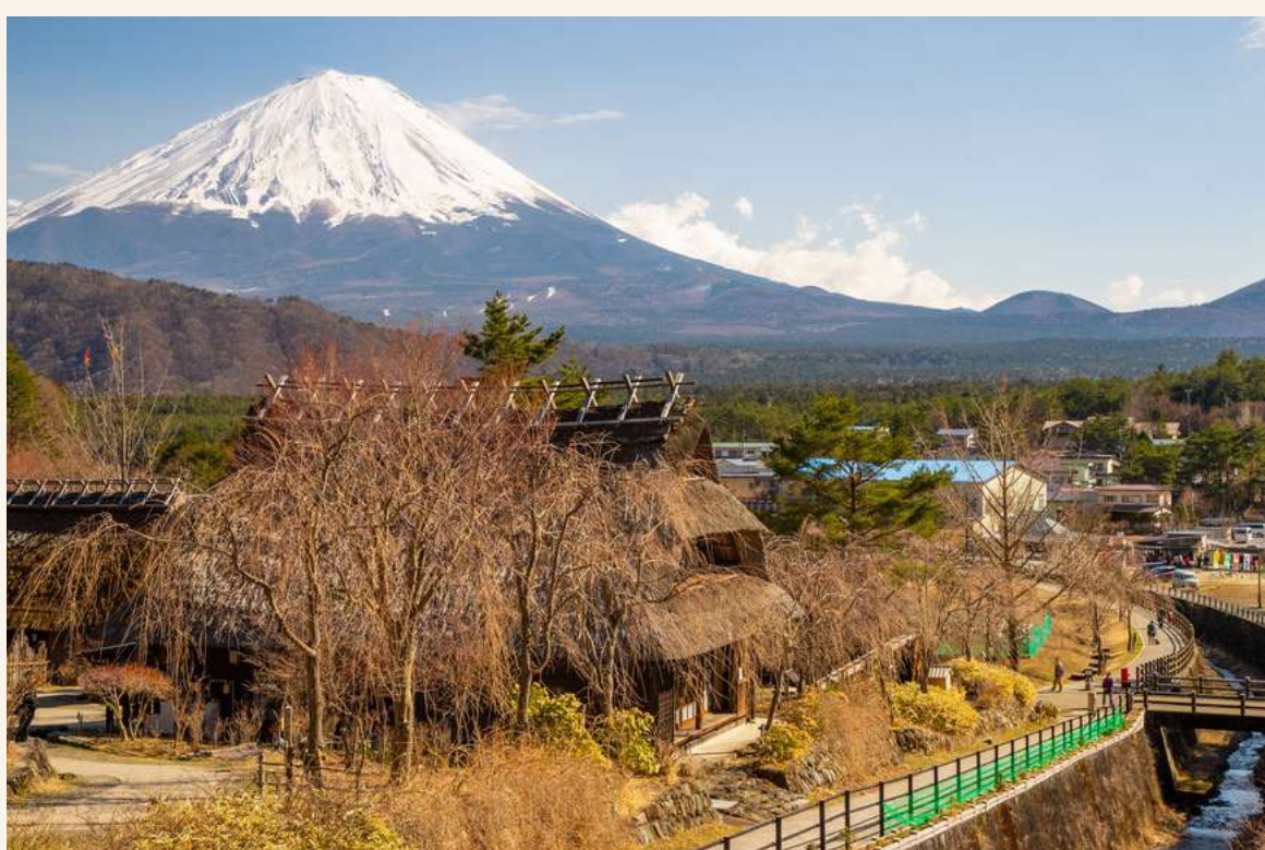
หมู่บ้านอิยาชิโนะ

วันที่ 4 : หมู่บ้านอิยาชิโนะ - ทะเลสาบ คาวากุชิโกะ - หมู่บ้านโอชิโนะ ฮักโก - โตเกียว