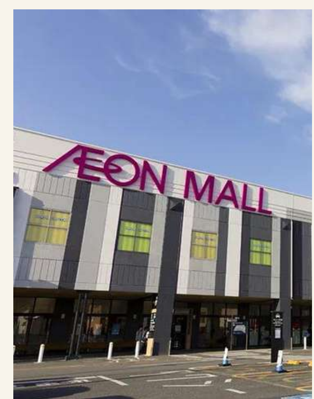
อีออนมอลล์ นาริตะ