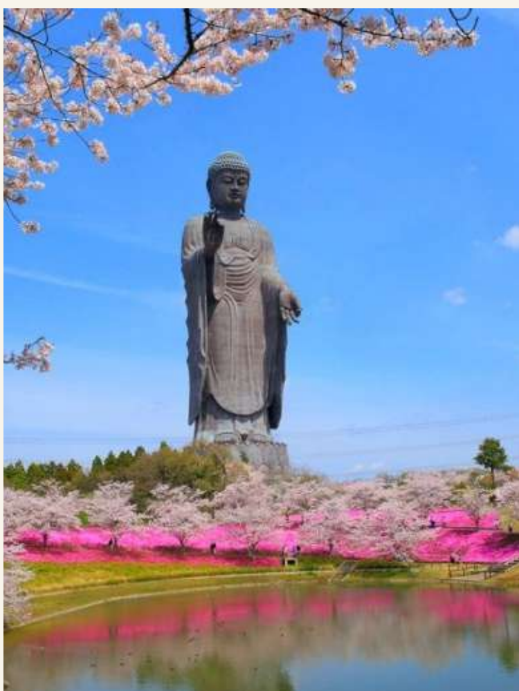
อูซึคุไตบุตสึ

วันที่ 1 : สนามบินนาริตะ - อูซึคุ ไตบุตสึ - ตลาดปลานากามินาโตะ - สวนอิตาชิไซด์ - utschinonemiyama