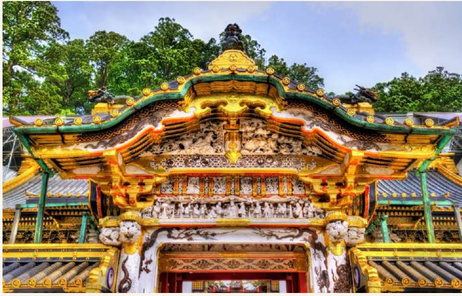
ศาลเจ้านิกโก้

วันที่ 2 : ศาลเจ้านิกโก้ - สะพานชินเคียว - น้ำตกเคงง - ไชตะมะ