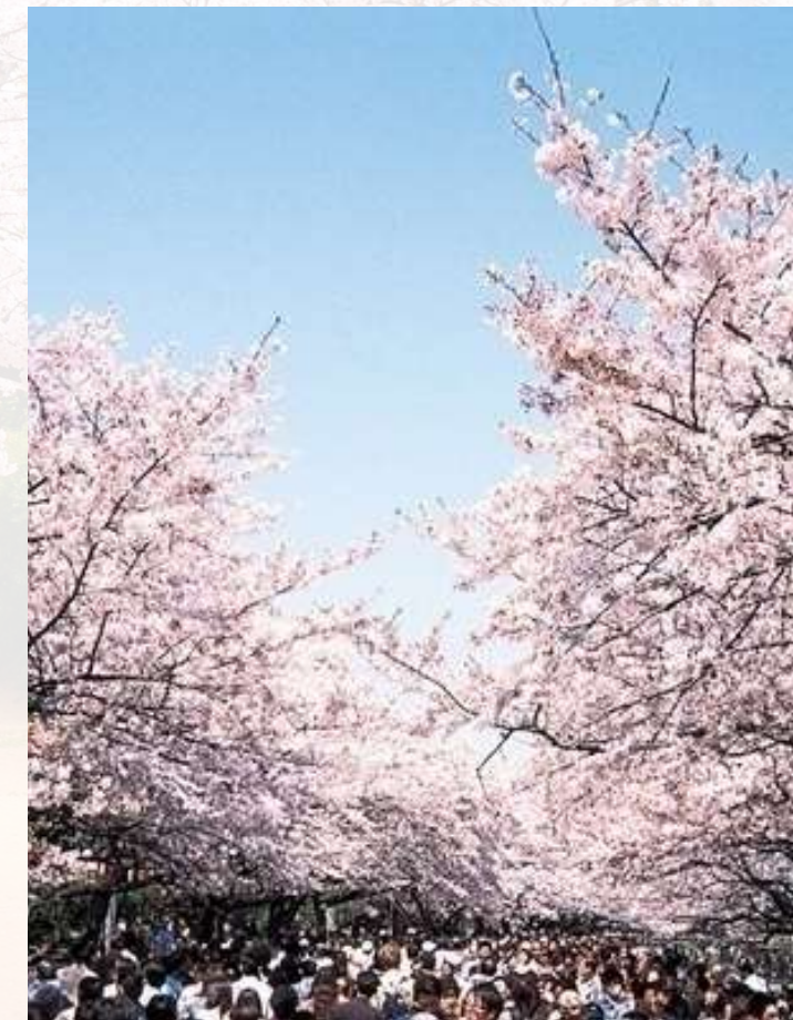
สวนอุเอโนะ