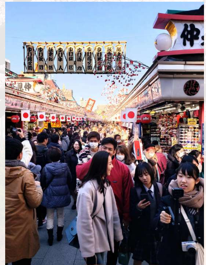
ถนนนากามิเสะ