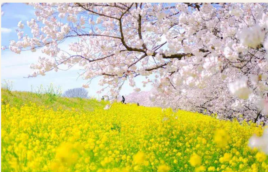
คุมากายะ ซากุระสีซิมิ

วันที่ 3 : ชมซากุระ คุมากายะ ซากุระสีซิมิ - ย่านเมืองเก่า คาวาโกเอะ - คาวากุจิโกะ