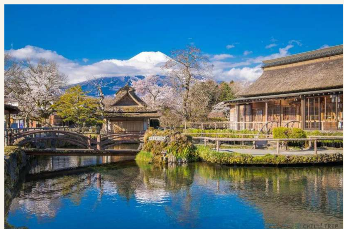
หมู่บ้านโอชิโนะ ฮักโก