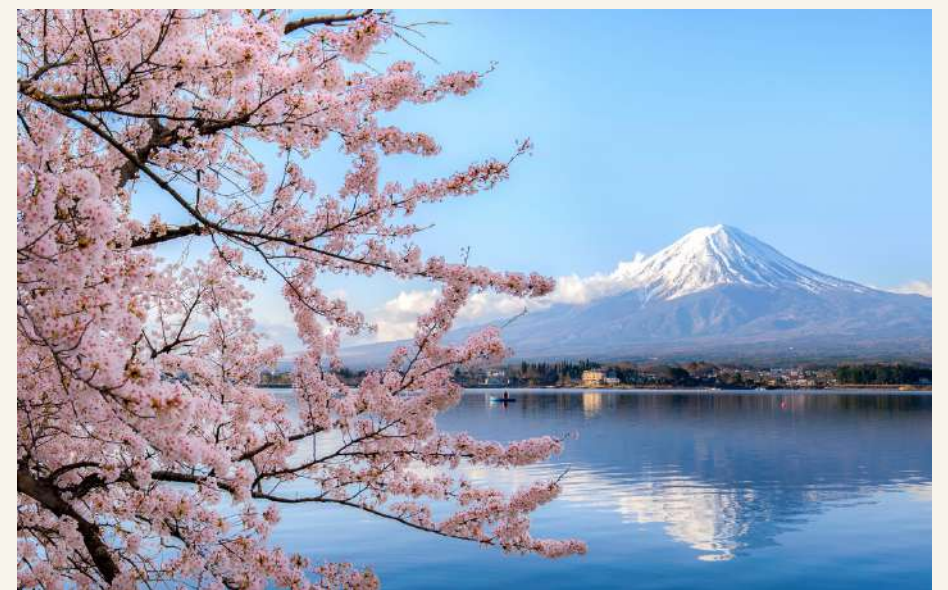
คาวากุจิโกะ

วันที่ 4 : หมู่บ้านอิยาชิโนะ - ทะเลสาบ คาวากุชิโกะ - หมู่บ้านโอชิโนะ ฮักโก - โตเกียว