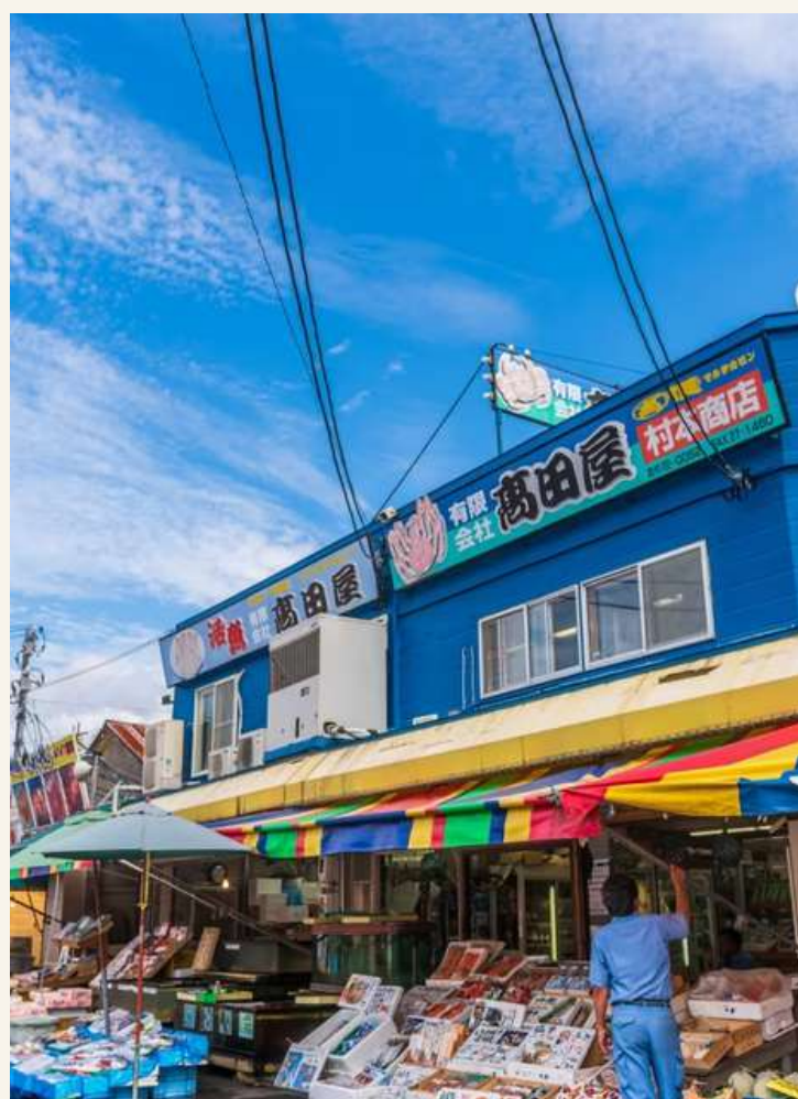
ตลาดปลานากามินาโตะ