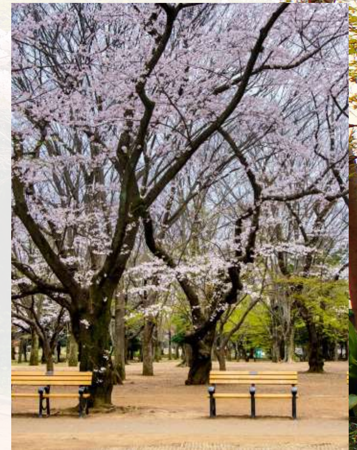
สวนโยโยจิ