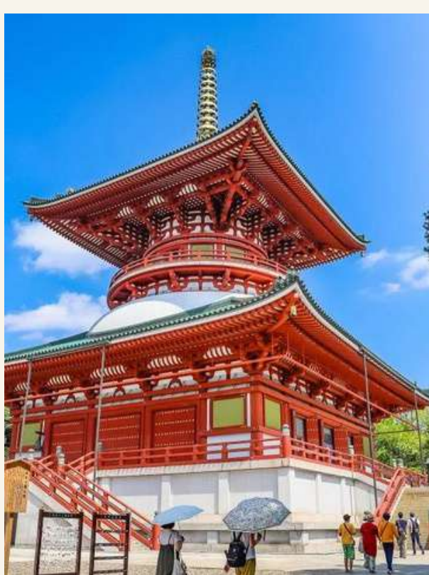
วัดนาริตะ