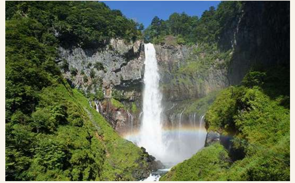
น้ำตกเคงง

วันที่ 3 : ชมซากุระ คุมากายะ ซากุระสีซิมิ - ย่านเมืองเก่า คาวาโกเอะ - คาวากุจิโกะ