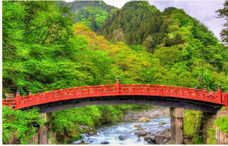
สะพานชินเคียว