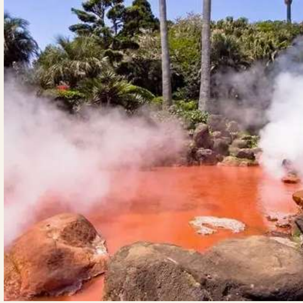
ชิโนเกะ จิโวกุ