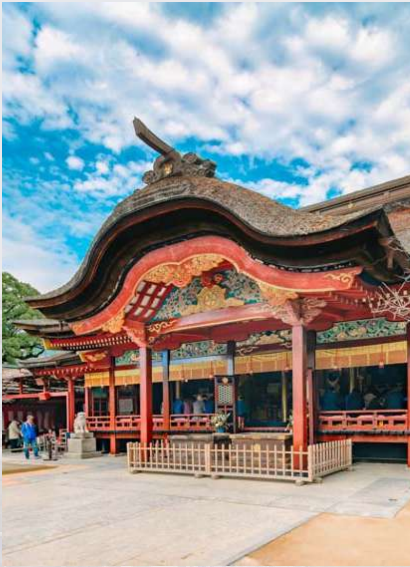
ศาลเจ้าโฮฟูเก็นมังกุ