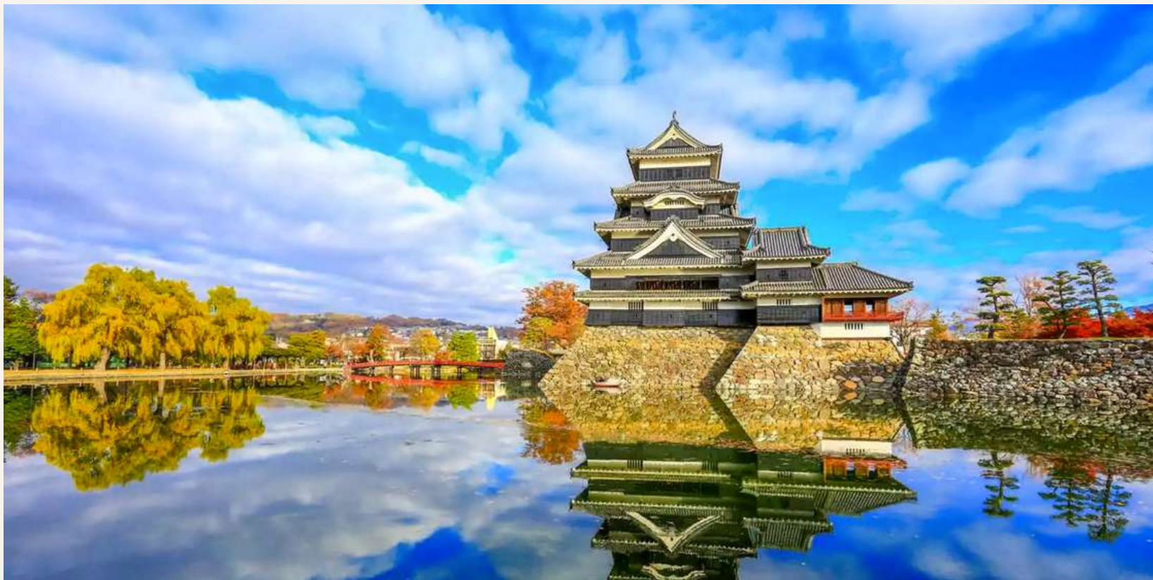
ปราสาทคุมาโมโตะ

วันที่ 3 : ปราสาทคุมาโมโตะ - วัดนันโซอิน - ซ็อบปิ้งย่าน เก็นจิน - เข้าที่พัก เมืองฟุกุโอกะ