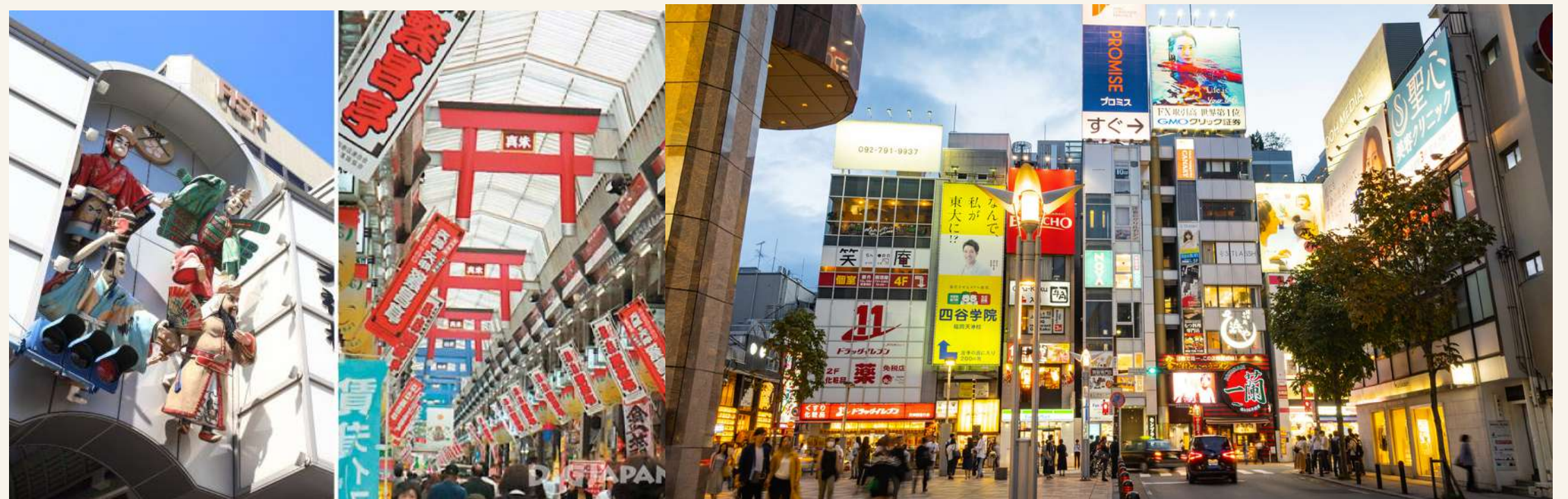
ย่านเก็นจิน