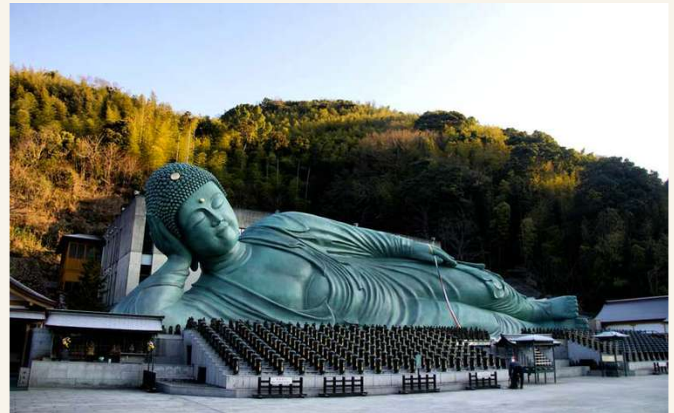
วัดนันโซอิน