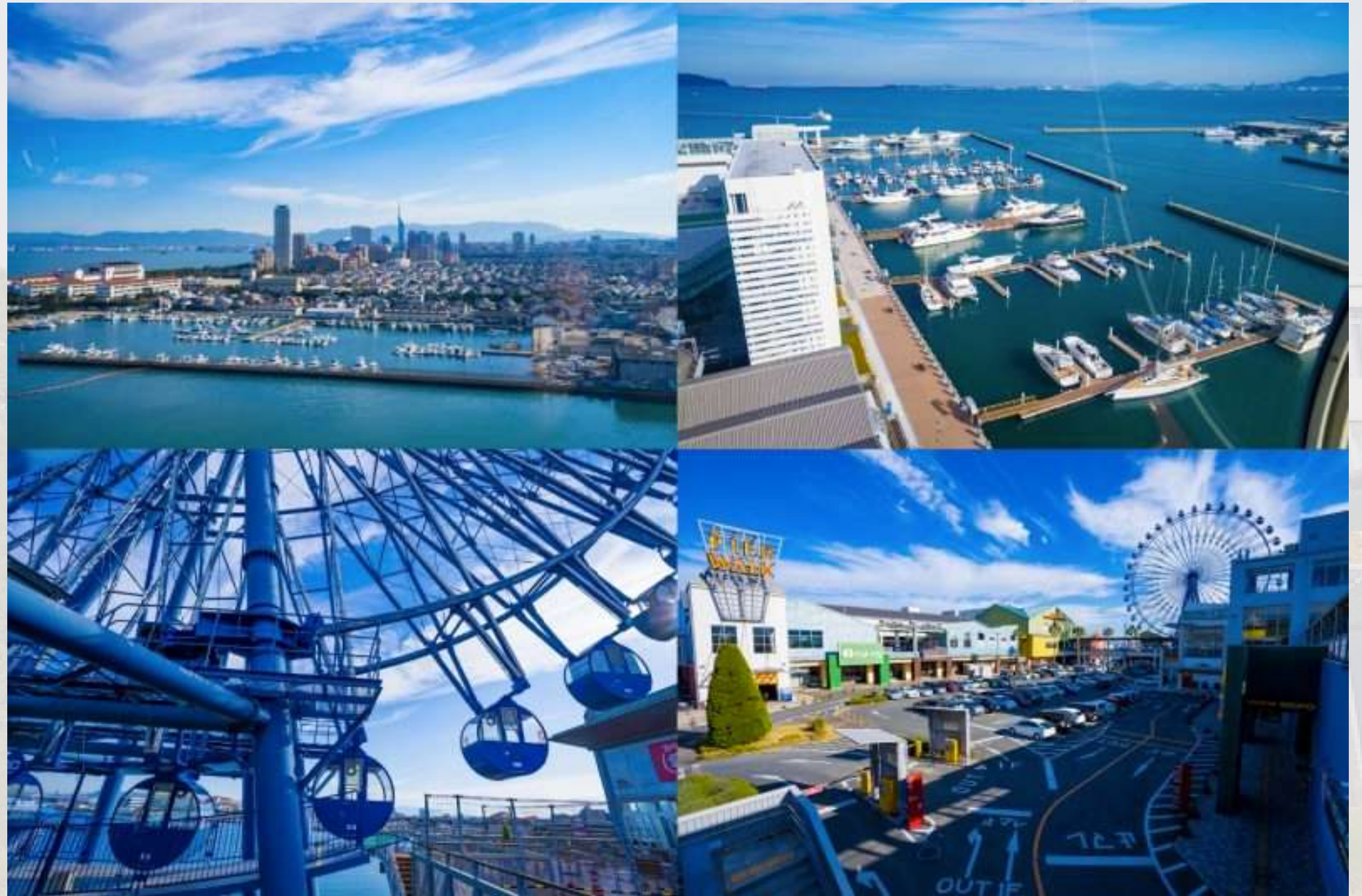
Marina City Fukuoka