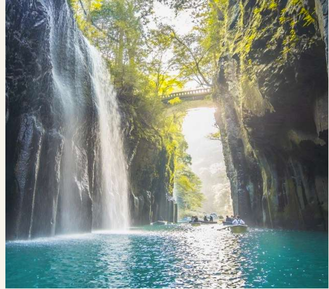
ช่องเขาทาคาจิโฮะ

วันที่ 3 : ปราสาทคุมาโมโตะ - วัดนันโซอิน - ซ็อบปิ้งย่าน เก็นจิน - เข้าที่พัก เมืองฟุกุโอกะ