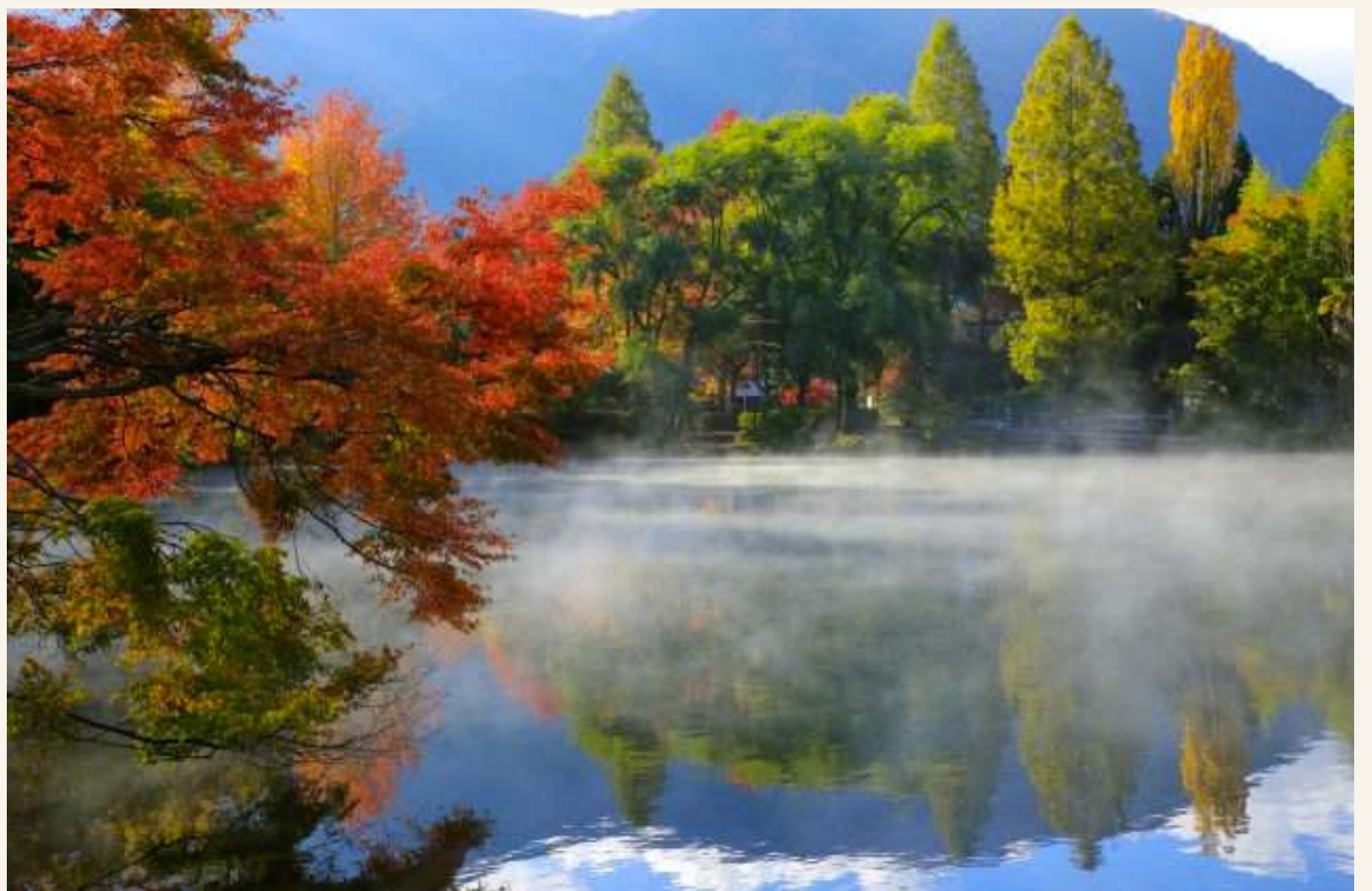
ทะเลสาบคิริน